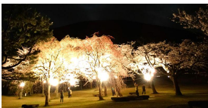
さくらの里 染井吉野ライトアップ