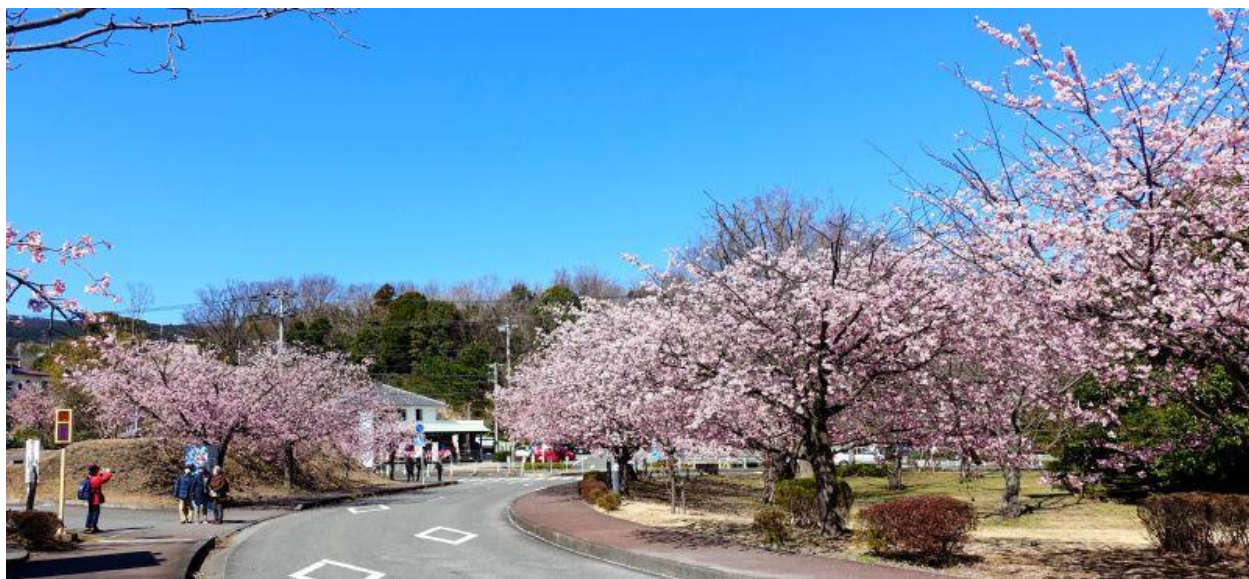
伊豆高原駅周辺 大寒桜

伊豆高原では、毎年3月中旬頃になると「伊豆高原桜まつり」が開催されます。桜まつりは、おおかん桜ステージ会場、桜並木ステージ会場、さくらの里ステージ会場の3つに分かれており、 ノオオカンザクラとソメイヨシ の見頃に合わせて行われています。各会場では、様々なイベントも行われており、お祭り期間中は多くの花見客で賑わっています。